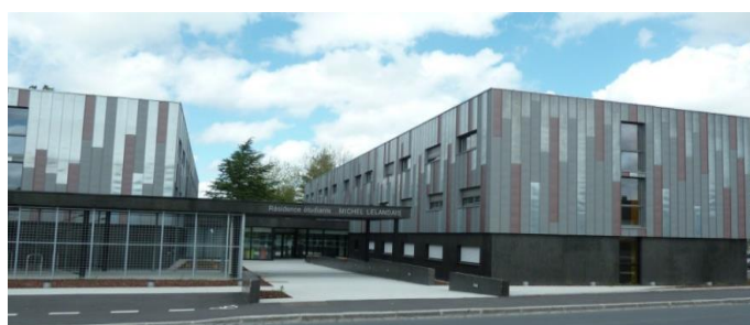
Résidence étudiante de Saint-Lô