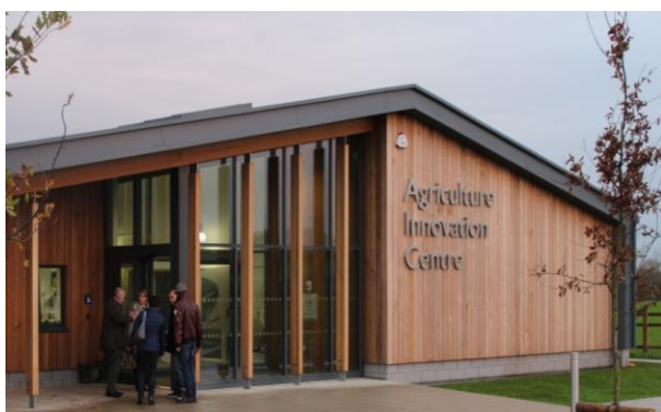
Locaux de Cannington

Pour financer ce parcours à l'étranger, les étudiants peuvent contracter un prêt étudiant auprès d'organismes bancaires.