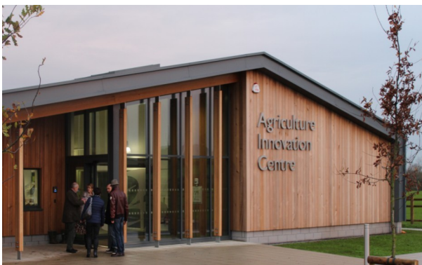
Locaux de Cannington

Pour financer ce parcours à l'étranger, les étudiants peuvent contracter un prêt étudiant auprès d'organismes bancaires.