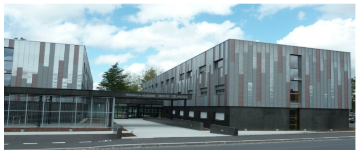
Résidence étudiante de Saint-Lô